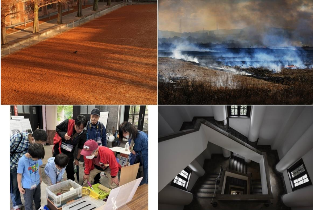
第3回コンテスト受賞作品（一部）

阿武山観測所や阿武山周辺を含む北摂地域で撮影された四季折々の写真を募集します。応募いただいた作品は主催者のWebサイト上に公開します。厳正な審査の結果入賞された作品は、賞品を贈呈すると共に、当NPOが出版する冊子などに掲載いたします。裏面の応募方法をご覧ください、ふるってご応募ください。